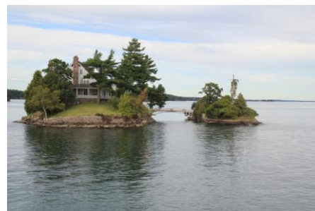
Kleinste Brücke CAN-USA

Nach dem eindrücklichen Tag bei den Auslandschweizern fuhren wir in Richtung Kingston Ontario. Am Mittag besichtigten wir das Upper Village (Ballenberg von Kanada). Dort wurde uns die Entstehung des zweitgrössten Landes auf dem Kontinent, Kanada, gezeigt. In eindrücklicher Weise zeigte man uns wie Sägereien, Mühlen und Wollen Fabriken mit Hilfe des Flusses betrieben wurden. Wir fuhren nach der Besichtigung des historischen Dorfes in Richtung 1000 Islands. Auf dem St. Lawrence Fluss befinden sich in einem Abschnitt die 1000 Islands. Es befinden sich sehr viele kleine Inseln auf dem Fluss, welche die Meisten verbaut wurden. Einige Leute bauten auf den Inseln ihre Feriendomizile. Ebenfalls findet man die kleinste Brücke der Welt auf dem Fluss, welche zwei Staaten miteinander verbindet, nämlich Kanada und die USA. Sehr eindrücklich