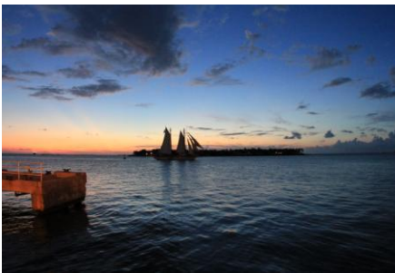
Sonnenuntergang in Key West

Piratenzeit. Wir bezogen unser Hotel und genossen den Rest des Tages in der Stadt in den verschiedenen Bars.