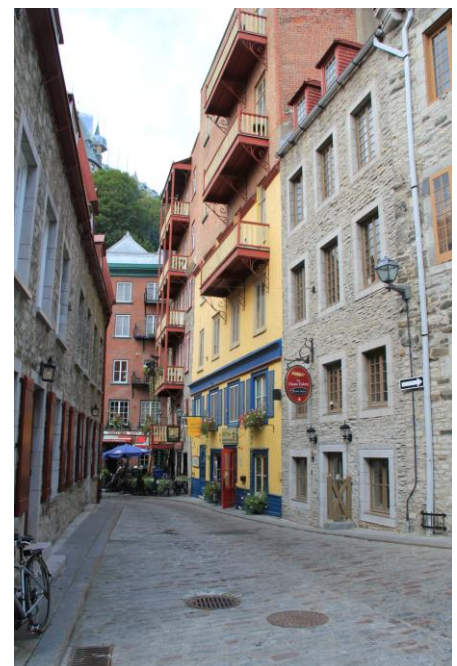
Altstadt Quebec City

Am Mittwoch nahmen wir auf einer Schifffahrt ein feines Mittagessen ein. Danach verbrachten wir den Nachmittag in der Altstadt bei einem Drink.