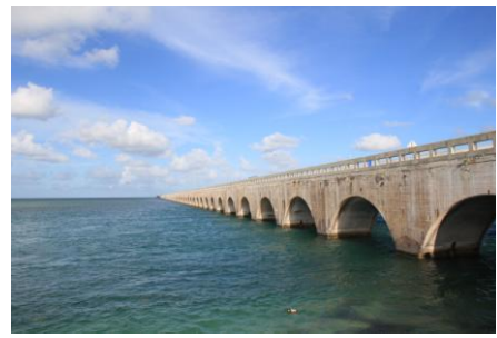
Brücke nach Key West

Miami wir kommen hiess es am nächsten Tag! Wir fuhren am frühen Morgen vom Hotel in Toronto in Richtung Flughafen. Nach dem Checking und der US Security Control, flogen wir mit der Air Canada in Richtung Miami. In Miami angekommen, stiegen wir gleich in den Reisebus und fuhren in Richtung Key West. Bei der Fahrt überquerten wir 37 Brücken bis wir auf der letzten Insel ankamen. Key West ist die südlichste Stadt in den USA. Sie ist geprägt von der