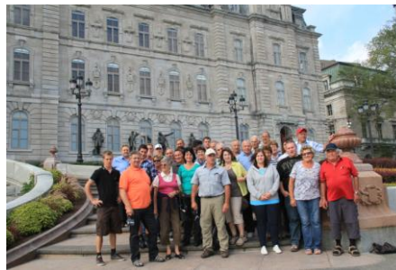
Reisegruppe in Quebec

Von unserem Hotel in Victoriaville ging es am nächsten Tag in Richtung Quebec. Auf der Strecke von Victoriaville- Quebec City, sah man die riesigen Berge der Asbestminen, welche stillgelegt wurden. Danach bezogen wir unser Hotel in Quebec und genossen noch den Abend in den Pubs.